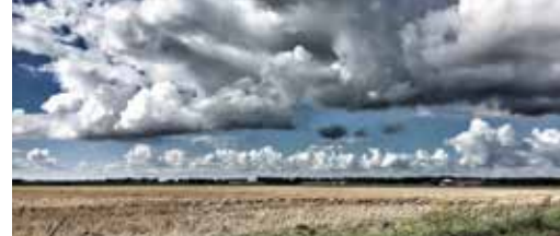
Gehuchten moeten blijven! p.3