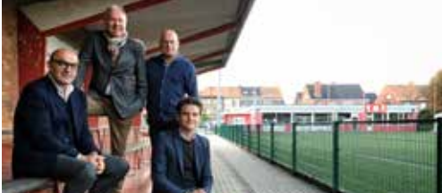
Kieldrecht op de kaart zetten p. 2